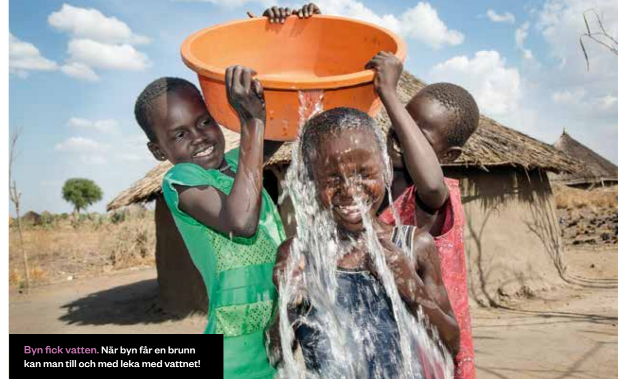
Byn fick vatten. När byn får en brunn kan man till och med leka med vattnet!