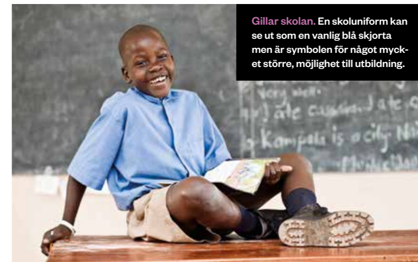
Gillar skolan. En skoluniform kan se ut som en vanlig blå skjorta men är symbolen för något mycket större, möjlighet till utbildning.