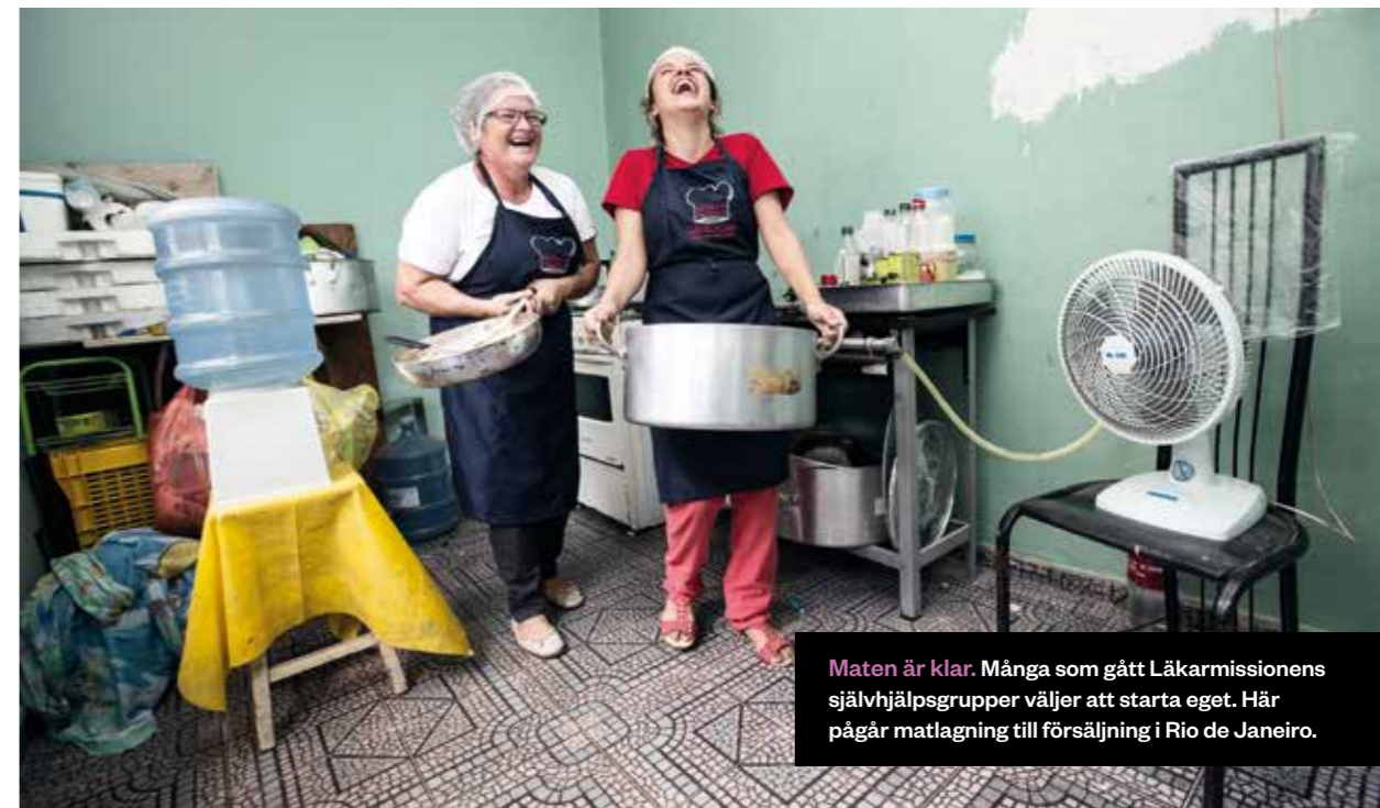
Maten är klar. Många som gått Läkarmissionens självhjälpgrupper väljer att starta eget. Här pågår matlagning till försäljning i Rio de Janeiro.